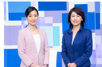
WBS(ワールドビジネスサテライト) 月～木 夜10:00 / 金 夜11:00

NOW ON TV テレビ放送で画面上にこのロゴが登場する番組は、リアルタイム配信中です