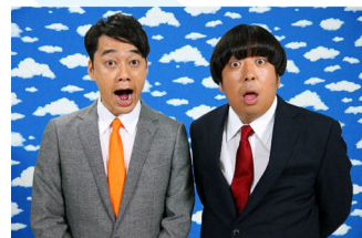
YOUは何しに日本へ? 月 夜6:25