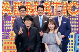
出没!アド街ック天国 土 夜9:00