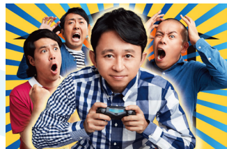
有吉いeeee!～そうだ!今からお前 ちでゲームしない? 日 夜10:00