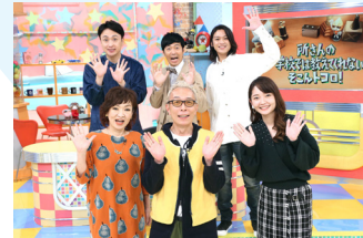
所さんの学校では教えてくれないそこん トコロ! 金 夜9:00