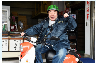
出川哲朗の充電させてもらえませんか? 土 夜7:54