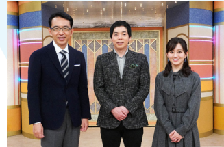
開運!なんでも鑑定団 火 夜8:54