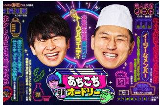
あちこちオードリー 水 夜11:06

自宅のパソコンで観ていた番組の続きを外先からスマートフォンで観る際には自動的に続きから再生され、スムーズに視聴することができます。