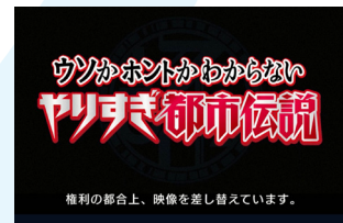
権利処理の都合上、配信で映せない 映像を処理した画面例

サービスを開始した4月クールでは、月～木曜は夜6時25分のバラエティから11時6分のドラマ/バラエティ/情報・ドキュメンタリーまで、金曜は夜6時25分のアニメ「妖怪ウォッチ♪」から11時の「WBS」まで、土曜は夜6時30分の「土曜スペシャル」から9時の「出没!アド街ック天国」まで、日曜は夜6時30分の「日曜ビッグバラエティ」から10時の「有吉いeeee!～そうだ!今からお前ちでゲームしない?」まで、毎日3～7番組をリアルタイム配信でお届けしました。