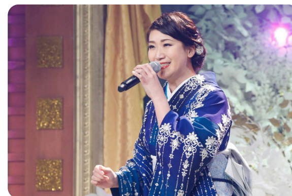
昨年の「日本作詩大賞」より