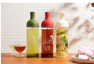
HARIO フィルターインボトル 2,640円(税込)

コーヒー・ティー関連用品やキッチンウェアで有名な、1921年創業の耐熱ガラスメーカー「HARIO」とコラボレーションしたフィルターインボトル(水出しボトル)が新登場。HARIOの商品の中でも人気の高い、フィルターインボトル初のスヌーピーデザインです。また、奈良の伝統産業・特産品である蚊帳生地に、高い技術と丁寧な手仕事が生きる伝統の友禅染めを施した「白雪ふきん」とのコラボレーションアイテムがLOVELY TOWNシリーズに仲間入り。LOVELY TOWNシリーズは「おかいものSNOOPY」を中心としたPEANUTSリタイラー及びライセンサー各社との連携企画となっており、これからも新商品が続々登場予定です。「おかいものSNOOPY」は今後もお客様に満足いただける商品をお届けしてまいります。