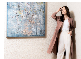
長谷寺の紅葉で染めたロングシャツ