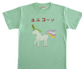
Tシャツ(ユニコーン)