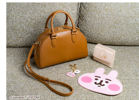
「キタムラ」×「カナヘイの小動物」コラボ商品

テレビ東京コミュニケーションズはキャラクターや地方創生に関する事業ノウハウを活用して「カナコレ」(https://kanacolle.jp)という新たなECサービスを開始しました。神奈川県の高品質な商品に人気キャラクターを組み合わせたり、県内の名所や企業とのコラボレーション企画を仕掛け、その魅力を全国に届けます。横浜元町の老舗バッグブランド「キタムラ」と「カナヘイの小動物」がコラボした商品は高品質な「キタムラ」を若い世代にアピールすることを狙っています。アパレルブランド「メーカーズシャツ鎌倉」とは、鎌倉長谷寺の紅葉、イチヨウの落葉を集め、それらで染色したワンピースやシャツを作りました。廃棄予定の植物や食品から色素を抽出し、糸・生地を染色して作った商品はSDGsのメッセージ発信も担っています。その他にも皆様楽しんでいただける商品を多数用意しております。モノづくりのストーリーも伝える工夫をしていますので、ぜひサイトにアクセスしてください！