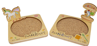
オーナメント付きコースター (2個セット)