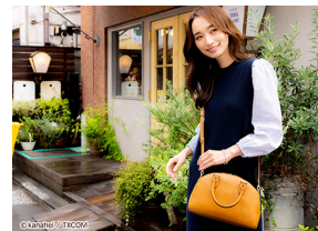
大人の女性にも似合う可愛らしい フォルムのバッグ