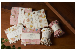
(写真上) 白雪友禅ふきん 600円(税込) (写真左下) 白雪友禅ハンカチポーチ 950円(税込) (写真右下) 白雪ヘアターバン 1,900円(税込)