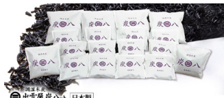
調湿木炭 出雲屋「炭八」 ダブルセット 9,980円(税込)

テレビ東京ダイレクトの通販「テレビ東京ショッピング」では、「じっくり ていねい だから、あんしん。」をコンセプトに、お客様の悩みに寄り添い、生活を豊かにする商品を提供しています。調湿木炭 出雲屋「炭八」は、直近3年間の合計受注金額が10億円を突破！ステイホームの影響もあり、室内運動機器などの売り上げも好調です。2021年9月にはこれまでの通販番組とは一風異なるテイストの「裁判風通販番組 熱血！虎ノ門勝男」を放送するなど、新しいテレビ通販の形も模索中。今後とも、テレビ東京ダイレクトにご期待ください。