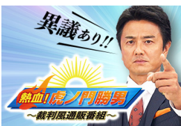
裁判風通販番組 熱血！虎ノ門勝男