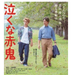
出演:堤真一 柳楽優弥 川栄李奈 竜星 涼 キムラ緑子 麻生祐未