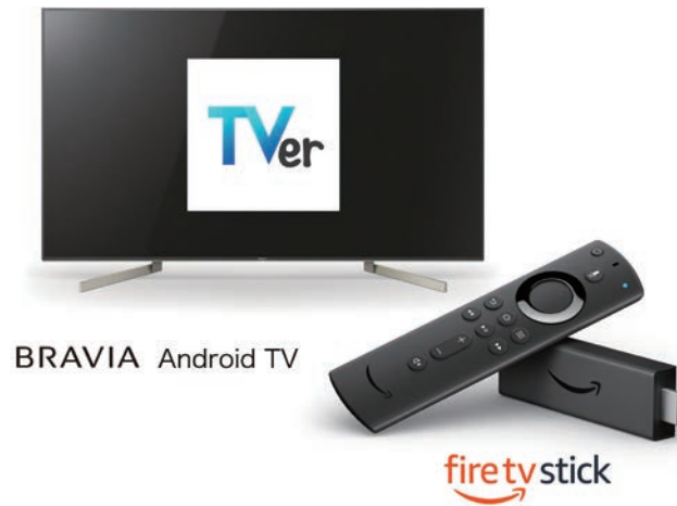
BRAVIA Android TV

*1 6/25現在、対応機種は、2015年以降に発売した Android TV 機能搭載 ソニーブラビア、Amazon Fire TV シリーズです。今後、対応機種は順次追加される予定です。