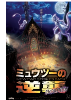
©Nintendo・Creatures・GAME FREAK・TV Tokyo・ShoPro・JR Kikaku ©Pokémon ©2019 ピカチュウプロジェクト

1998年に上映した記念すべきポケモン映画第1作「劇場版ポケットモンスター ミュウツーの逆襲」。興行収入72億円超、動員数654万人を記録し、原点であり最高峰である本作品が今年の夏、フル3DCG映像で新たに描かれます。ゲスト声優には1998年当時と同じく市村正親、小林幸子らを起用。シリーズ最大のヒット作の新たな映像体験をスクリーンでお届けします。