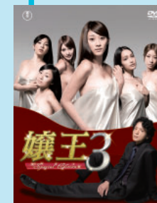
©「嬢王3～Special Edition～」 制作委員会 ©「嬢王 Virgin」倉科遼、紅林直 / 集英社 ヤングジャンプコミックス BJ刊