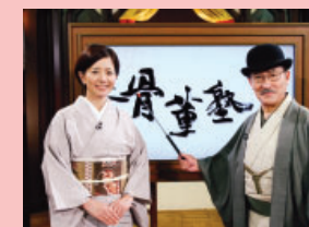
鑑定団が3倍面白くなる! 目からウロコの骨董塾

放送収入は、通販番組を含むレギュラー番組をはじめ、タイム収入、スポット収入ともに好調でした。番組販売収入は、スピンオフ企画「だいきけ君が行く!!ポチたま新ペットの旅」「鑑定団が3倍面白くなる!目からウロコの骨董塾」などのローカル局への売上げが好調でした。