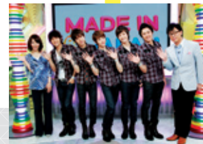
月～金 / 18:00～生放送

韓国、台湾、香港などアジアの旬なスターがいち早く生出演。グルメ、エステ、ファッション等のアジア最新情報も必見! モバイルサイトもコンテンツが盛り沢山。