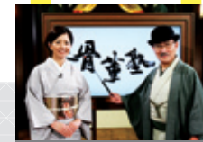
木 / 21:00～

地上波で放送する「開運!なんでも鑑定団」の鑑定士等が、骨董のイロハや目利きのポイントを教えます。