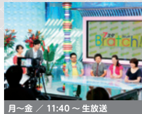
月～金 / 11:40～生放送

Bratch(ブラッチ)は「ぶらり」と「watch」の造語。旬な情報や生活を彩る魅力的なグッズを紹介。